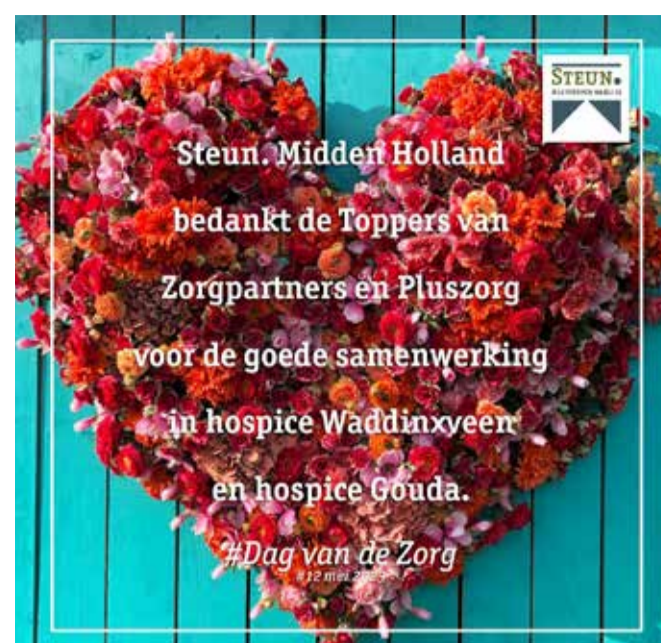
Op vrijdag 12 mei 2023 vierden we de Dag van de Zorg en bedankten we de toppers van Zorgpartners en Pluszorg voor de goede samenwerking.

Nabijheid, thuis, dichtbij elkaar. Sinds Covid 19 zijn we ons er nog bewuster van dat dat is waar het om gaat, vooral in de laatste levensfase. Vanuit die behoefte aan nabijheid zijn er hospices gekomen en organisaties die mensen thuis ondersteunen. Particuliere initiatieven gericht op kwaliteit van zorg en ondersteuning.